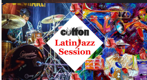
cotton Latin Jazz Session